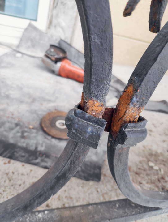
Beispiel eines frisch sandgestrahlten und dann neu beschichteten Geländers. Der Rost unter den Bündeln ist geblieben.