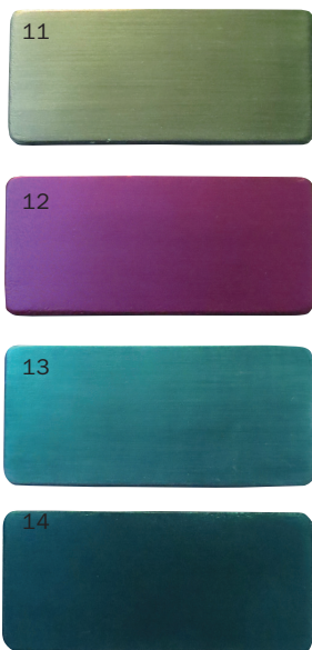
Pfauenfeder: Lichteinfall und Position des Betrachters spielen eine entscheidende Rolle für die Wirkung.

Die Eigenheit von Perlmutter ist seine grosse Variationsbreite in Bezug auf die Farbe. Durch die Mischung von zwei Effektpigmenten (Muster 10), hier «Pyrisma Türkis» und «Perlglanz Magic Royal Damask», wird der Effekt von Interferenz, ähnlich demjenigen eines dünnen Ölfilms auf Wasser, erreicht. Hier wird deutlich, dass durch das Mischen von Effektpigmenten spezifische Erscheinungsweisen addiert werden können. Damit eröffnet sich ein weites Feld für einzigartige Oberflächen.