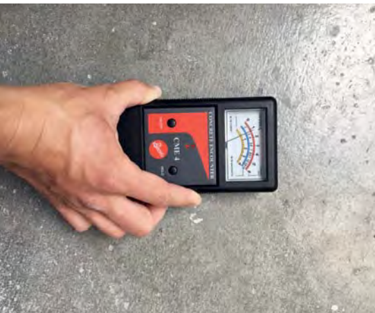
Messung der Untergrundfeuchtigkeit.