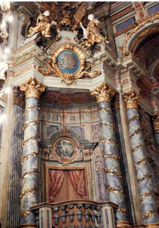
Virtuose Malerei auf mit Leinwand bespanntem Holz in einer Trompeterloge