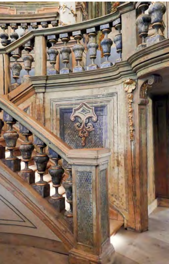
Nach rund sechs Jahren Restaurierung sieht das Opernhaus wieder wie zu Zeiten Wilhelmines aus.

tage war möglich, weil man für solche Bauten auf serielle Vorfertigung setzte und auf Techniken aus dem Kulissenbau. Das glockenförmige Logenhaus ist ein Fachwerk-Ständerbau, dessen Logen und Zugangstreppen komplett aus Holz erstellt sind. Die Teile dafür wurden vorab geschreinert, bemalt und, teilweise heute noch sichtbar, durchnummeriert. So konnte man sie vor Ort rasch zusammensetzen.