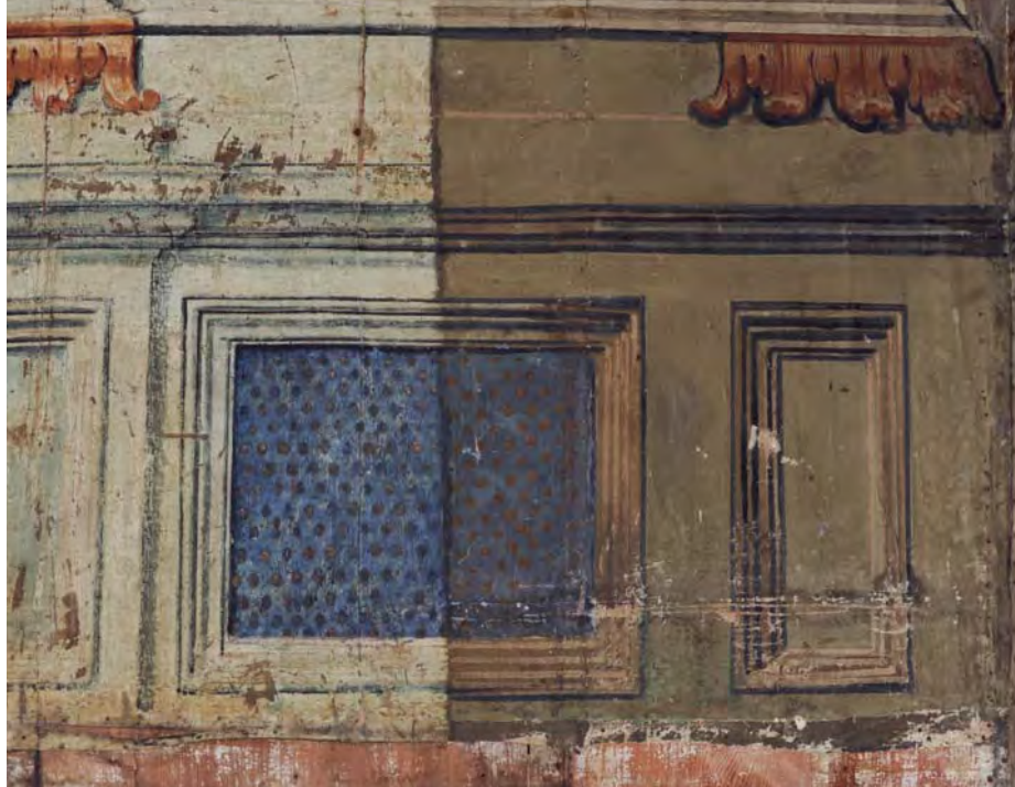
Fürstenloge (innen) Nord-west, in Höhe des 1. Rangs: Zustand während der Konservierung (Malschichtfestigung, Abnahme der Übermalungen, Überzüge und Retuschen). Die linke Seite im Bild ist bereits bearbeitet.

ginalen Schichten wieder frei zu legen und sie dort, wo sie sich gelöst hatten, zu festigen. In den 1970er-Jahren hatte man im Opernhaus eine, wie man heute weiss, nicht ideal konzipierte Klimaanlage eingebaut, die bald zu sichtbaren Schäden an der Malerei und Vergoldung führte. «Die vielen, später aufgebracht und spannungsreichen Farb- und Bindemittelschichten verursachten unter den Klimaschwankungen das Ablösen der originalen Mal- und Grundierungsschichten vom Holzuntergrund. Deshalb mussten die Übermalungen entfernt werden», sagt Speckhardt.