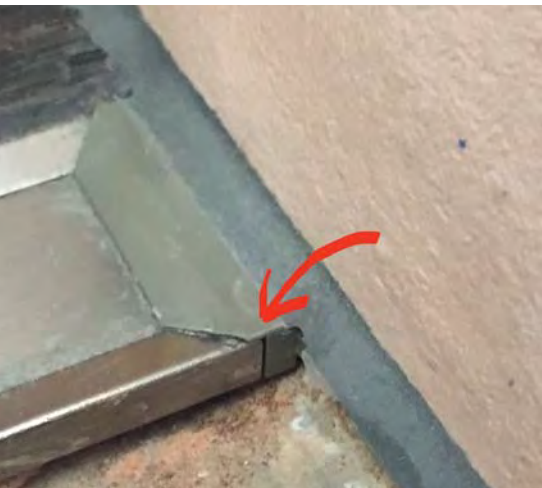
Gekürzte Enden der Duschrinne sind eine Schwachstelle.

Fugenlose Systeme versprechen eine neue, zeitgemässe Optik und eine pflegeleichte Oberfläche. Es handelt sich um Mehrschichtsysteme, die den neuesten architektonischen Trends entsprechen. Denn fugenlose Systeme ermöglichen die Realisierung nahtlos ineinander übergehender Beschichtungen. Es stellt sich daher die Frage, ob sie die Problemlöser der Zukunft sind.