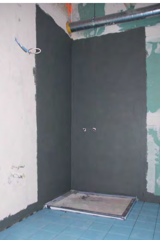
Auf die Abdichtung und die Details kommt es an.

Der Einsatz von Gipszementputz in Feuchträumen führt zu Diskussionen oder gar Schäden. Saint-Gobain Weber entschied sich vor fünf Jahren, sein entsprechendes Produkt nicht mehr für die Anwendung im Nassbereich freizugeben. Das liegt nicht am Material, sondern am Trend zu grossformatigen Platten, der höheren erforderlichen Druckfestigkeit und oft unsachgemässen Verarbeitung.