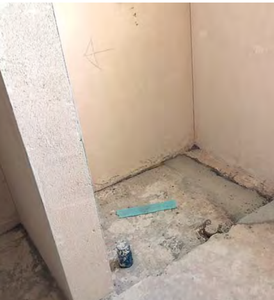
Der im Umbau des SMGV verwendete Grundputz ist ein neuartiger Weisszement-Grundputz.

baut als kleinformatige. Darum können gipszementgebundene Produkte, deren Druckfestigkeit < 6 \text{ N/mm}^2 ist, in Feuchträumen grundsätzlich zunehmend weniger eingesetzt werden.