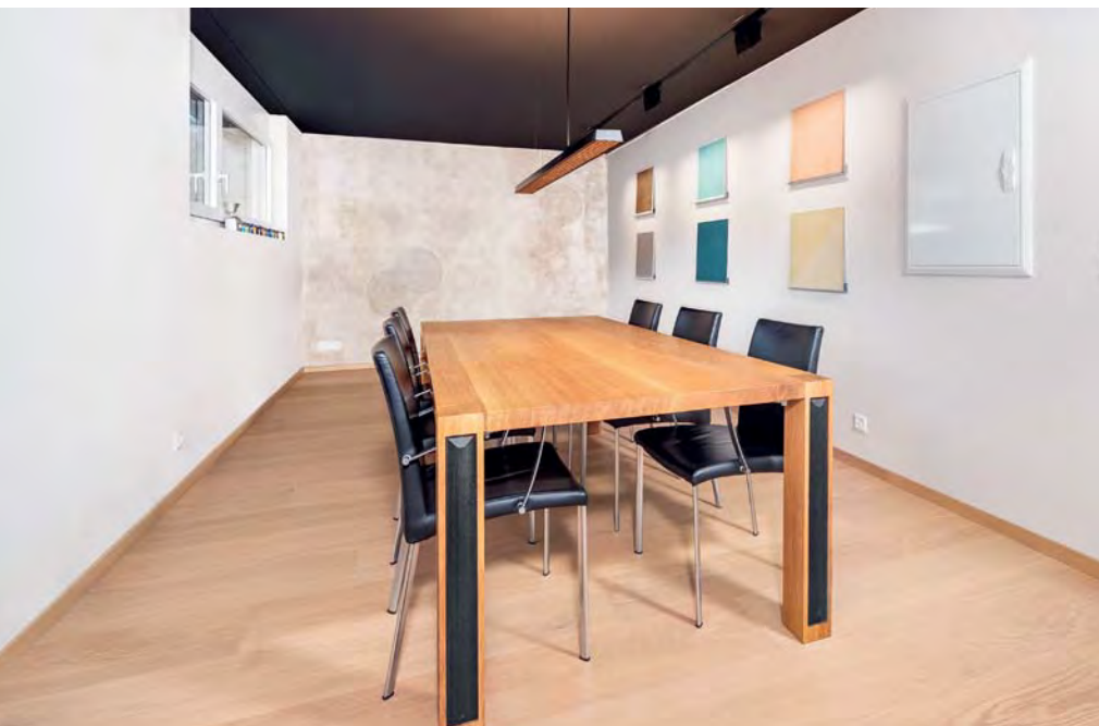
Das Sitzungszimmer als Showroom: Calce Cruda und eine Akustikdecke mit eingebauten Lautsprecherboxen zeigen, was das Maler- und das Gipserhandwerk zu bieten haben.