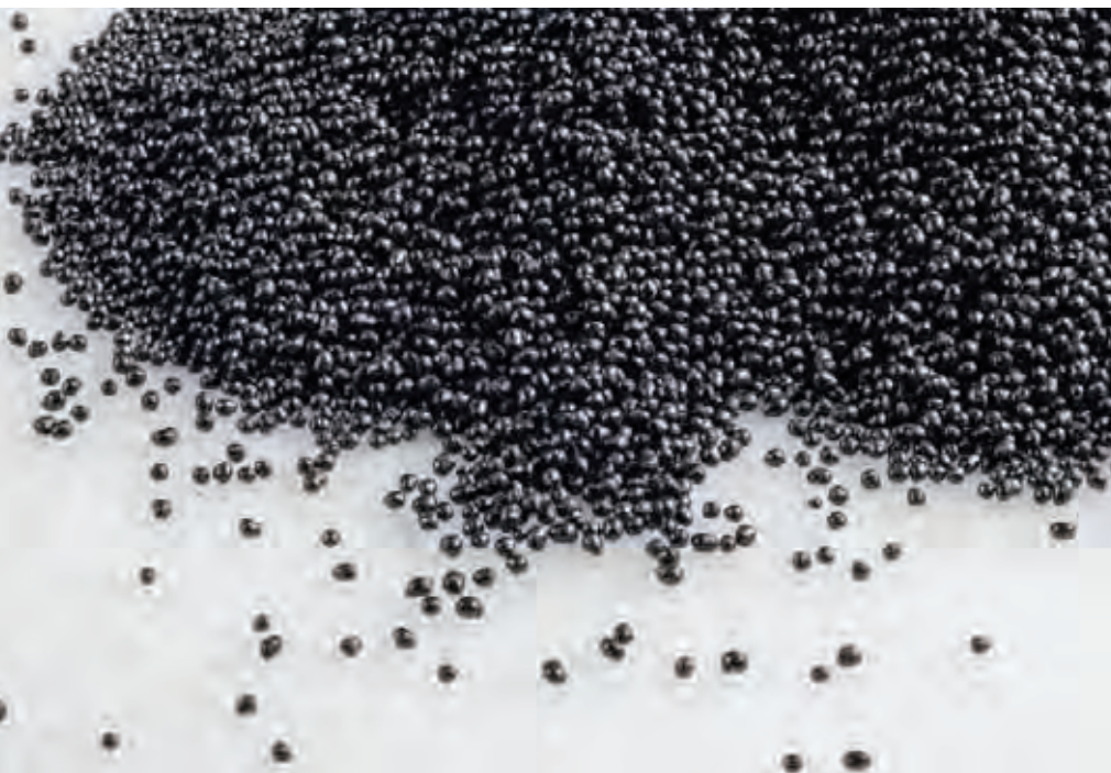
EPS-Dämmstoffe werden aus Granulat hergestellt.

Umweltverträglichkeit und Nachhaltigkeit spielen in Gesellschaft und Wirtschaft eine immer grössere Rolle. Darum achten vor allem institutionelle Bauherrschaften zunehmend auf die Ökobilanz von Baustoffen. Dies gilt auch für die Dämmung. Stichfeste Aussagen lassen sich nur machen, wenn die Bauteile mitberücksichtigt werden. Dabei zeigt sich: EPS ist besser als sein Ruf.