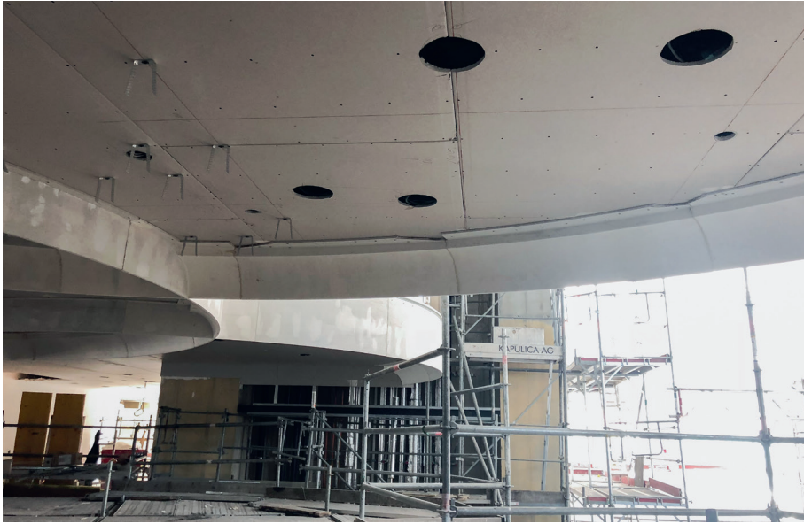
Abgehängte Decke als Installationsebene zur Aufnahme der Formteile und der Akustikdecke.