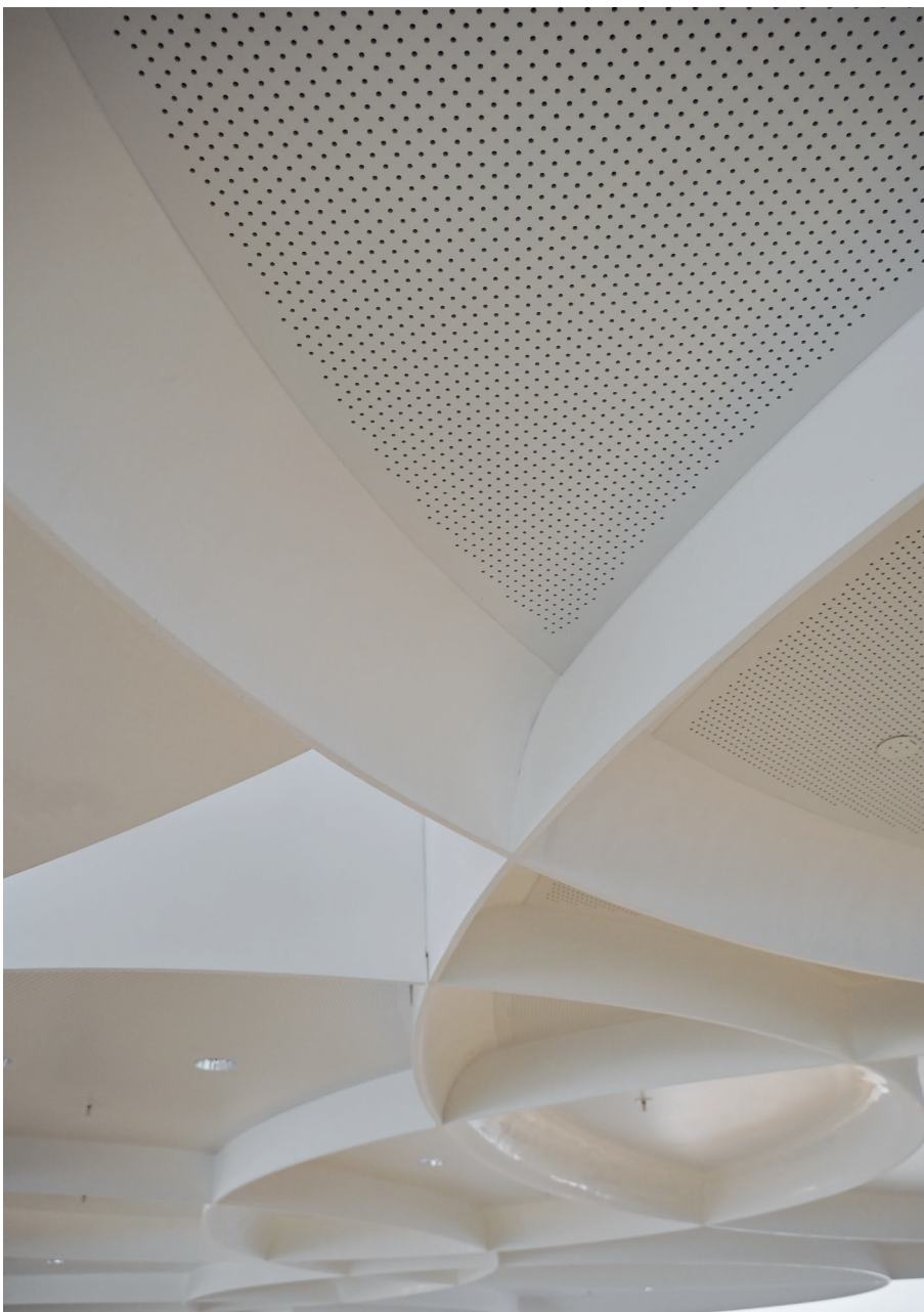
Die Präzision sieht man nur, wenn man unmittelbar unter den Kreuzungspunkten steht.

Es ist möglich, die Elemente aus Gipsplatten händisch herzustellen. Das bedeutet aber viel Aufwand.