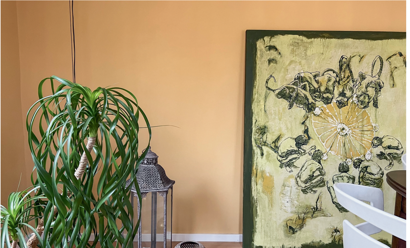
Wand in einer Wohnung, in welcher der Lehmputz in jedem Raum eine andere Farbe hat.