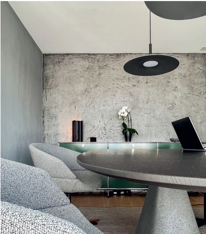
Diese Betonimitation ist in Zusammenarbeit mit Hugo Peters entstanden.