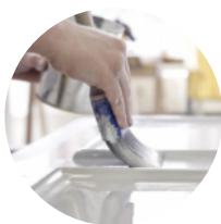
Travaux de peinture