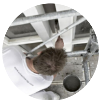
Enduits intérieurs et extérieurs