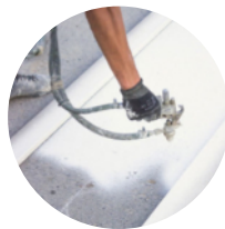
Marquages de routes et de places