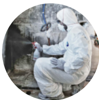
Assainissement contre les moisissures