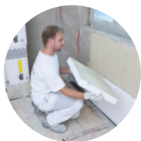
Isolamento termico interni