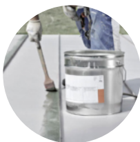
Rivestimento di protezione dalla corrosione