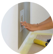
Tecniche di decorazione murale