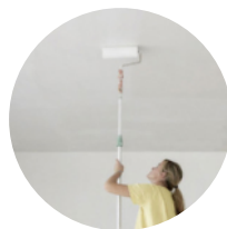
Lavori di intonacatura di coperture all'interno e all'esterno